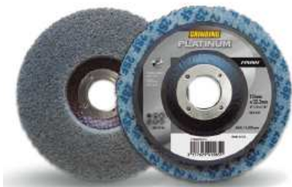
Disco Platinum Finish Migliorare la superficie