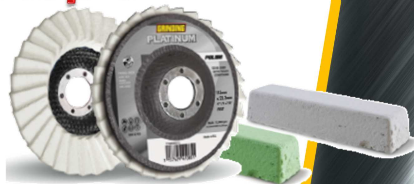
Disco Platinum Feltro Per finitura a specchio