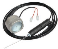
Freno elettromagnetico F (cod. 1312111)