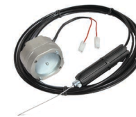
Freno elettromagnetico F (cod. 1312111)