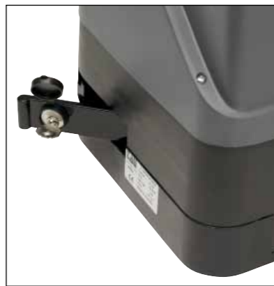
Sblocco manuale protetto da chiave personale. Manual release with personal key protection.