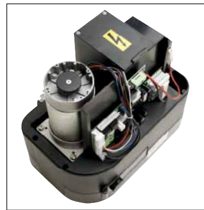
Versione 12 Volt con encoder e quadro elettrico di comando dotato di alloggiamento per la batteria di emergenza ricaricabile. 12 Volt encoder version with control unit equipped with rechargeable emergency battery location.