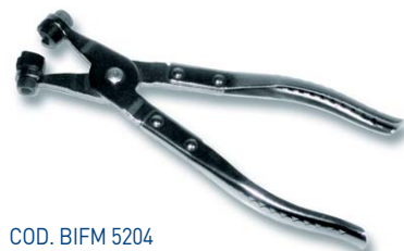
COD. BIFM 5204 UTENSILE MANUALE