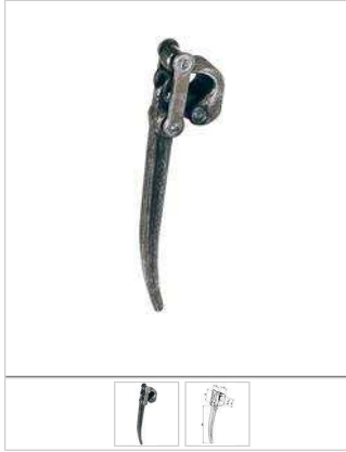
Chiusura marotta brevettata