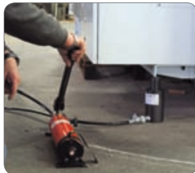
CSE50/100 per sollevamento di macchinario.