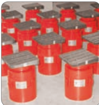
Serie CSE 1000/200 GS cilindri ritorno sotto carico con piastra inclinata per livellamento sezione di ponte.