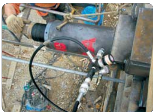
Cilindro forato a semplice effetto con ghiera di sicurezza CRM 60/260 GS per operazioni di lancio ponti.